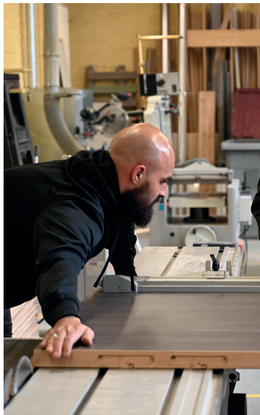
Réparation de la porte de la salle polyvalente de la Mairie de

Depuis fin 2021, la Comed (Construction maintenance et énergie durables) regroupe deux directions, celle de la Maintenance des Bâtiments et de la Maîtrise d'Ouvrage et Conduite d'Opérations. Bien plus que des acronymes, elle comprend « des équipes très impliquées qui ont le sens du service public ». Toutes les compétences au service des travaux sont représentées et réparties dans les différents centres techniques. La direction compte aussi le garage