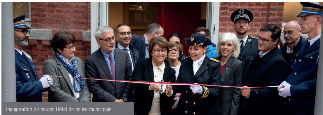
Inauguration du nouvel Hôtel de police municipale.