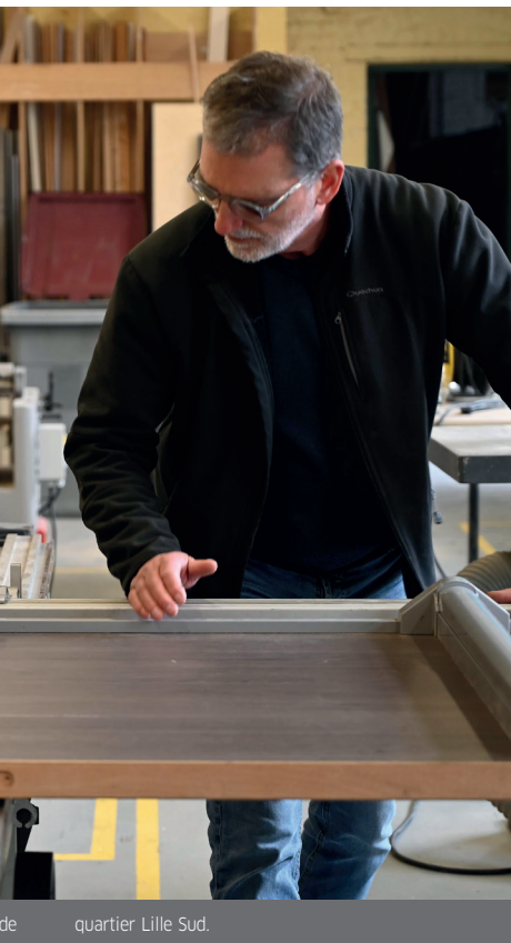
de quartier Lille Sud.