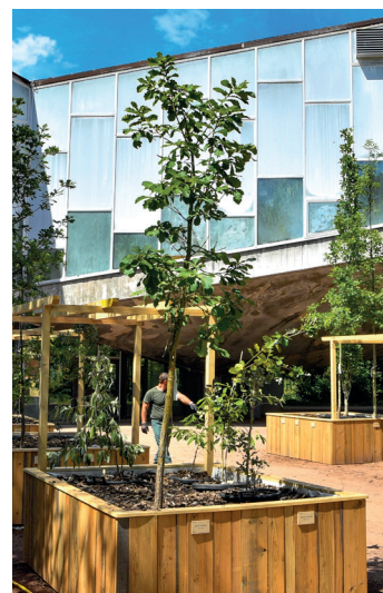
Installation de la collection de chênes : 58

Et une passion, ça se transmet. De nombreux ateliers sont organisés tout au long de l'année pour le public, sans oublier les trois rendez-vous annuels : Lille aux Plantes d'avril, le Rendez-vous aux jardins de juin et les Journées du patrimoine de septembre. Bref, de quoi relier l'Homme à la nature, une belle promesse qui fait écho à la thématique d'Utopia. ●