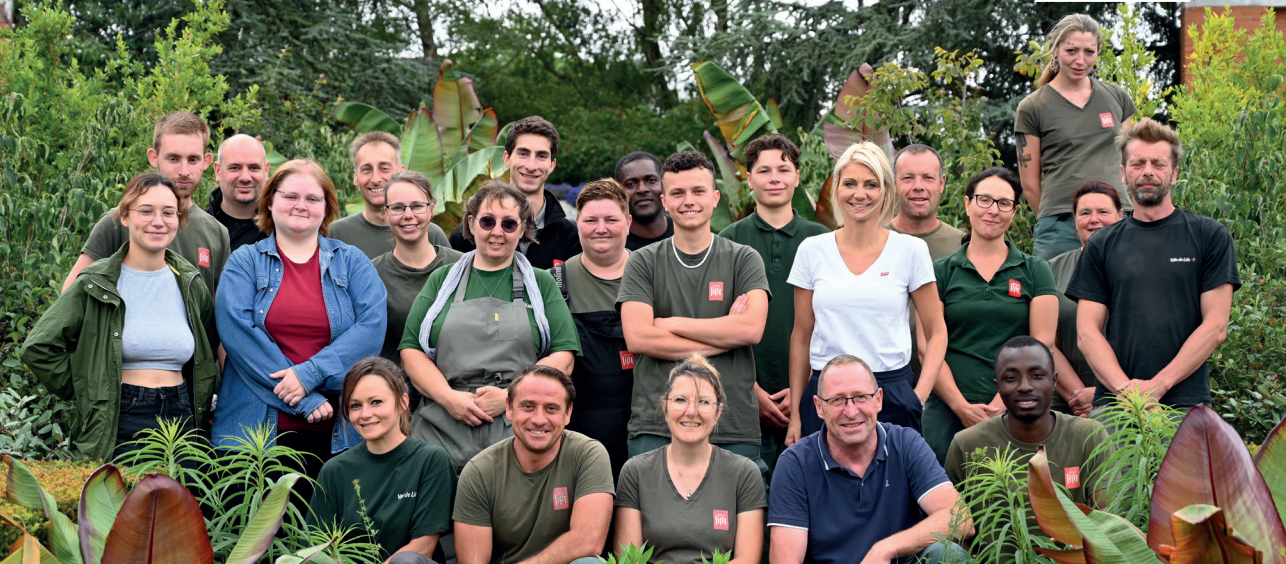
L'équipe du Jardin des plantes au grand complet.