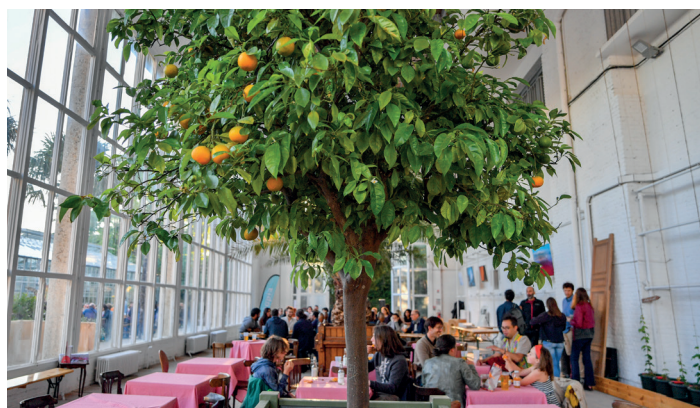
Restauration estivale à l'orangerie.