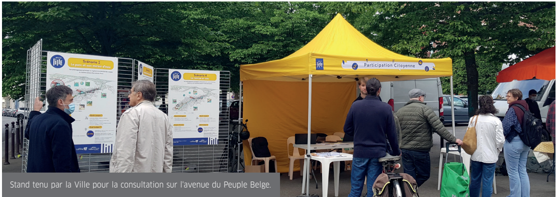
Stand tenu par la Ville pour la consultation sur l'avenue du Peuple Belge.